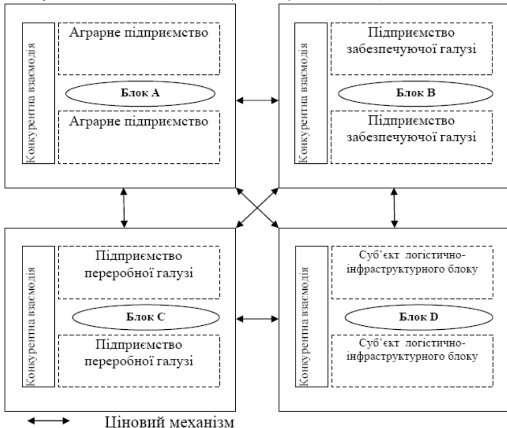
Рис. 1. Структура об'єкту механізму зовнішнього впливу на економічний розвиток підприємств агропромислового виробництва

1) фінансова сфера (фінансові кола), наприклад, фондові біржі, банки, інвестиційні компанії, брокерські фірми, акціонери, дебітори, кредитори, фінансові консультанти. Фінансові кола впливають на можливість підприємства забезпечувати себе капіталом, тобто на отримання грошових коштів;