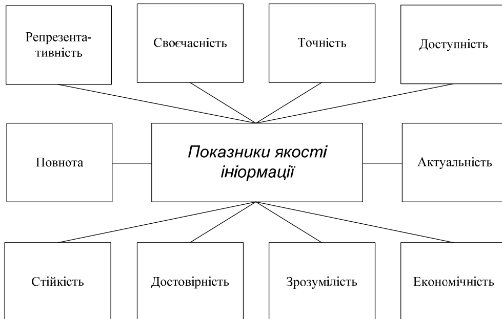
Рис. 3. Система показників якості інформації для аналізу господарської діяльності

Забезпечення наведених якісних характеристик інформації визначають її корисність для аналізу господарської діяльності.