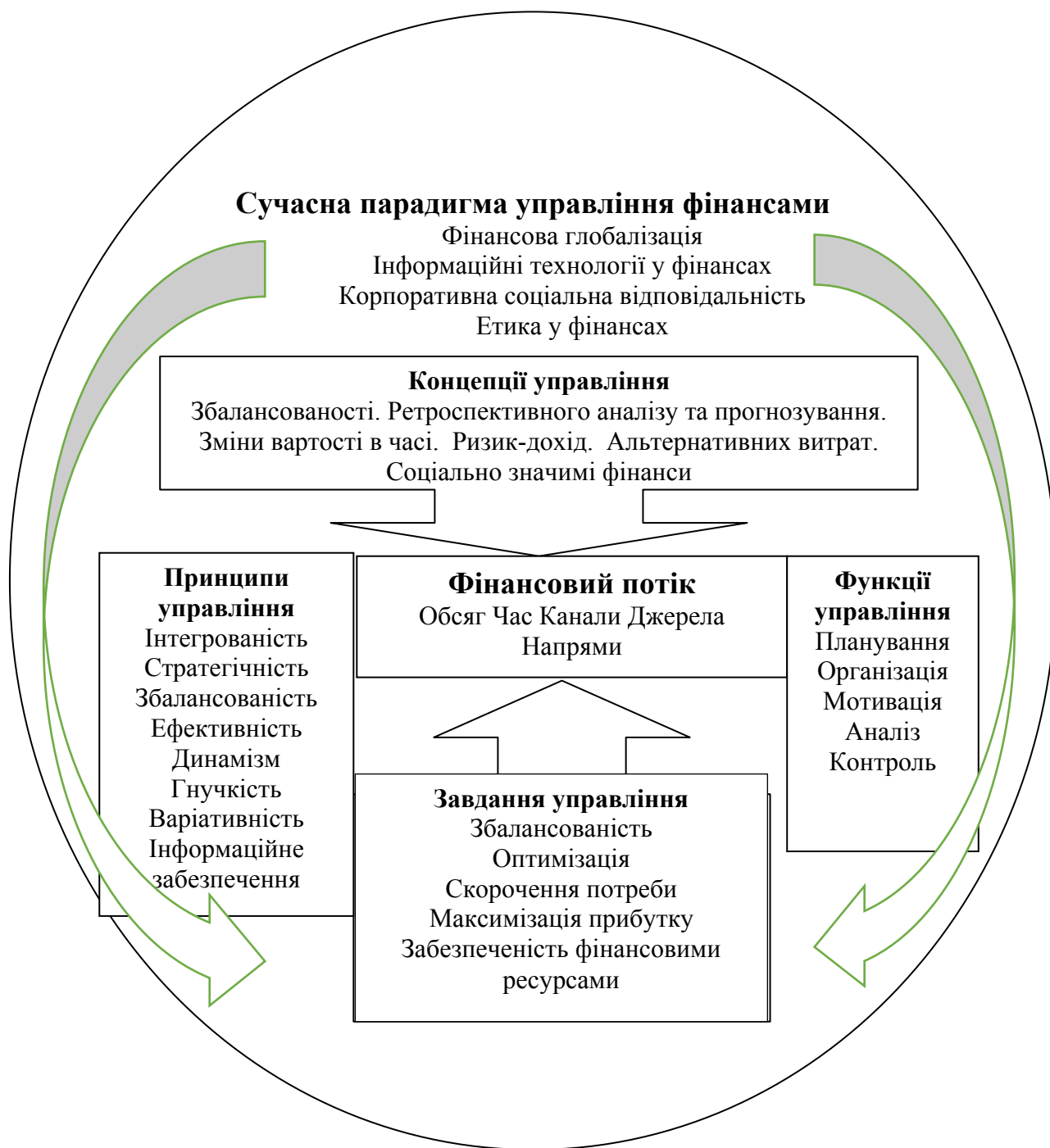
Рис. 2. Схема управління фінансовими потоками суб'єкта господарювання* *Авторська розробка

Контроль і регулювання передбачають координацію руху фінансових потоків відповідно до визначених критеріїв і параметрів, визначених цілей і поставлених завдань.