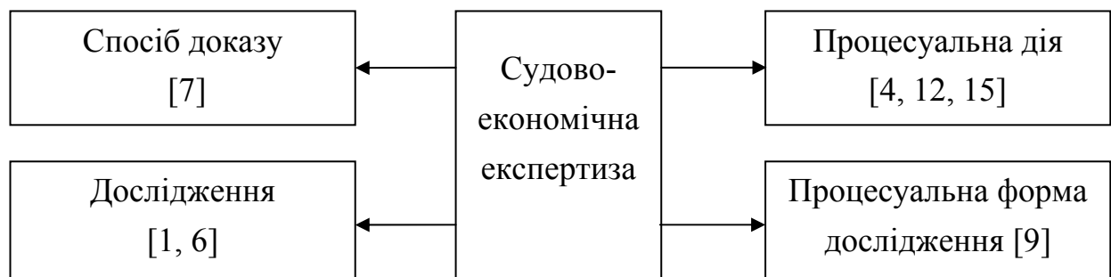
Рис. 2. Підходи науковців до визначення сутності судово-економічної експертизи (узагальнено автором)

Як зазначено на рис. 2, вчені трактують судово-економічну експертизу як з точки зору судочинства (спосіб доказу, процесуальна дія), так і з урахуванням функції перевірки, яку вона виконує (дослідження). Але найбільш ґрунтовним, на думку автора, є розуміння судово-економічної експертизи як процесуальної форми дослідження.