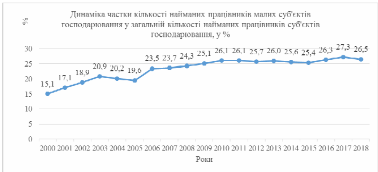
Рис. 1. Динаміка частки кількості найманих працівників малих суб'єктів господарювання у загальній кількості найманих працівників суб'єктів господарювання за 2000-2018 рр. (побудовано на основі даних з [15])

Малий бізнес відіграє важливу роль в економічному розвитку країни, оскільки він є не лише важливим джерелом інновацій у різних сферах економіки, але й виконує важливу функцію забезпечення зайнятості населення. При цьому варто відзначити, що динаміка частки кількості найманих працівників малих суб'єктів господарювання у загальній кількості найманих працівників суб'єктів господарювання за вельми тривалий період з 2000 р. по 2018 р. може вважатися цілком позитивною; дані, наведені на рис. 1, свідчать про те, що значення цього показника збільшувалося від 15 % у 2000 р. до в середньому 25-26 % починаючи з 2010 р.