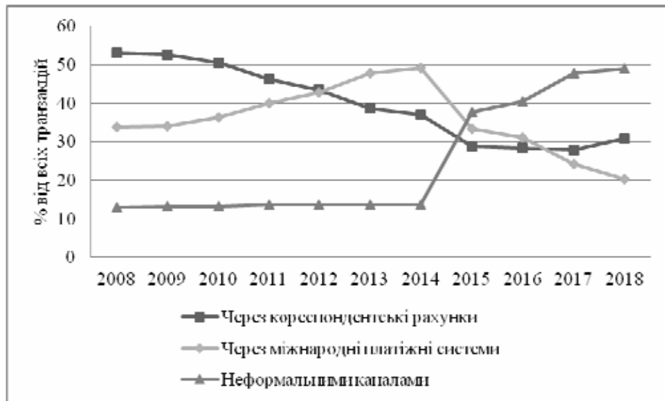
Рис. 3. Розподіл всіх транзакцій за каналами пересилання (Узагальнено автором на основі [7], [8])

В країнах з обґрунтованою економічною політикою, грошові перекази часто використовуються як інвестиції. Зміцнюючи інфраструктуру фінансового сектору та сприяючи міжнародним подорожам, країни можуть збільшити потоки грошових переказів, залучаючи кошти через офіційні канали. Велика кількість тіншових трансфертів пов'язана з тим, що транзакційні витрати на перекази коштів часто перевищують 20 відсотків від їхньої суми, зменшення їх навіть на 5 відсоткових пунктів у світовому еквіваленті може призвести до економії в 3,5 мільярди доларів для робітників, які пересилають гроші додому.