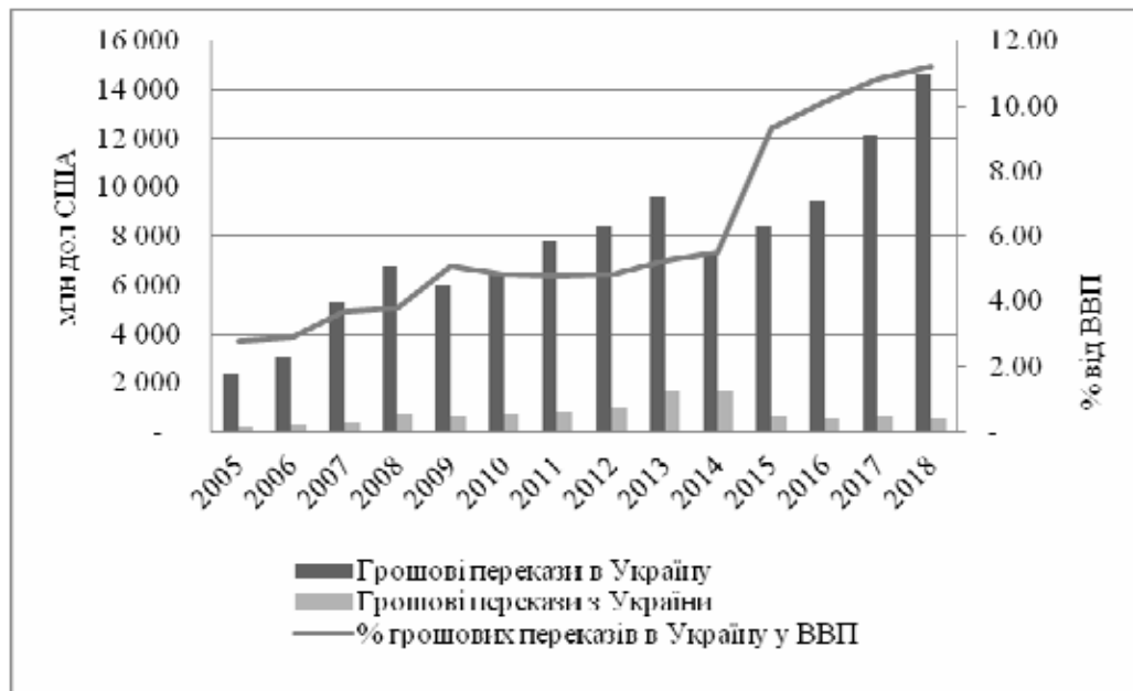
Рис. 2. Розподіл грошових переказів мігрантів (Узагальнено автором на основі [7])

Відповідно до даних Світового банку щодо цін на переказ, середня вартість відправки 200 доларів у країни з середнім доходом та доходом нижче середнього, залишалася на рівні 7 відсотків у першому кварталі 2019 року, приблизно на такому ж рівні, як у попередніх кварталах. Це більш ніж удвічі більше цілей розвитку до 2030 року, згідно з якими вартість відправки має складати не більше, ніж 3% від платежу. Найнижчою була вартість відправки у Південній Азії, і становила 5 відсотків, тоді як в Африці на південь від Сахари було зафіксовану найвищу середню вартість - 9,3 відсотка від суми переказу [9, с. 18].