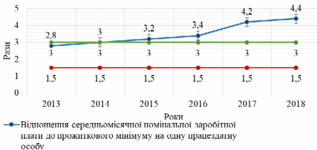
Рис. 1. Динаміка відношення середньомісячної номінальної заробітної плати до прожиткового мінімуму на одну працездатну особу за 2013 – 2018 рр.

Аналіз індикаторів показав, що на оптимальному рівні знаходяться лише 3 індикатори: відношення середньомісячної номінальної заробітної плати до прожиткового мінімуму на одну працездатну особу; співвідношення загальних доходів 10 відсотків найбільш та найменш забезпеченого населення (децильний коефіцієнт фондів); загальна чисельність учнів денних загальноосвітніх навчальних закладів.