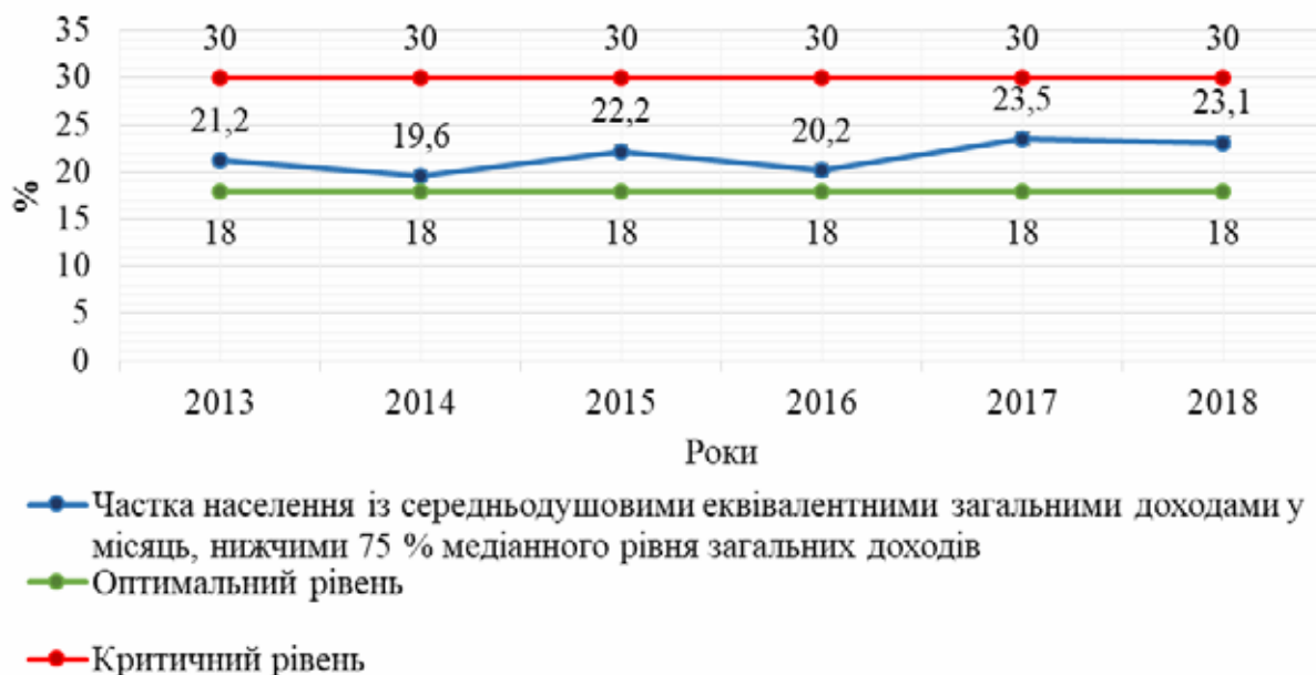
Рис. 2. Динаміка частки населення із середньодушовими еквівалентними загальними доходами у місяць, нижчими 75 відсотків медіанного рівня загальних доходів протягом 2013—2018 рр.

Зобразимо динаміку частки населення із середньодушовими еквівалентними загальними доходами у місяць, нижчими 75 відсотків медіанного рівня загальних доходів протягом 2013—2018 рр. графічно (рис. 2).