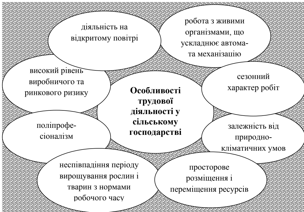
Рис. 1. Особливості трудової діяльності у сільському господарстві