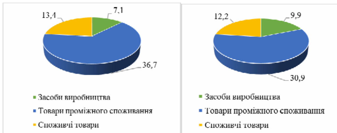
Рис. 1. Порівняння структури імпорту України в 2010 р. та 2018 р., млрд. дол. США

загального імпорту. Збільшення частки імпорту засобів виробництва в період із 2010 по 2018 рр. на 6,1 в.п., здебільшого пояснюється неможливістю вітчизняних підприємств задовольнити внутрішній попит у сучасних машинах, верстатах, обладнанні, необхідних для модернізації та виробництва конкурентоспроможної продукції.