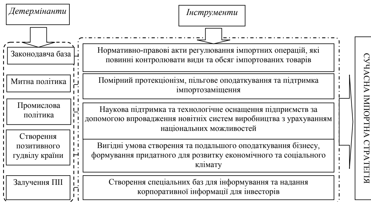
Рис. 3. Детермінанти трансформації імпоротної політики України

Вищезазначене спричиняє необхідність трансформації імпоротної політики та створення нових напрямків і шляхів розвитку національного виробництва. Розглянемо детермінанти трансформації імпоротної політики в сучасних соціальних, економічних та політичних умовах розвитку України (рис. 3).