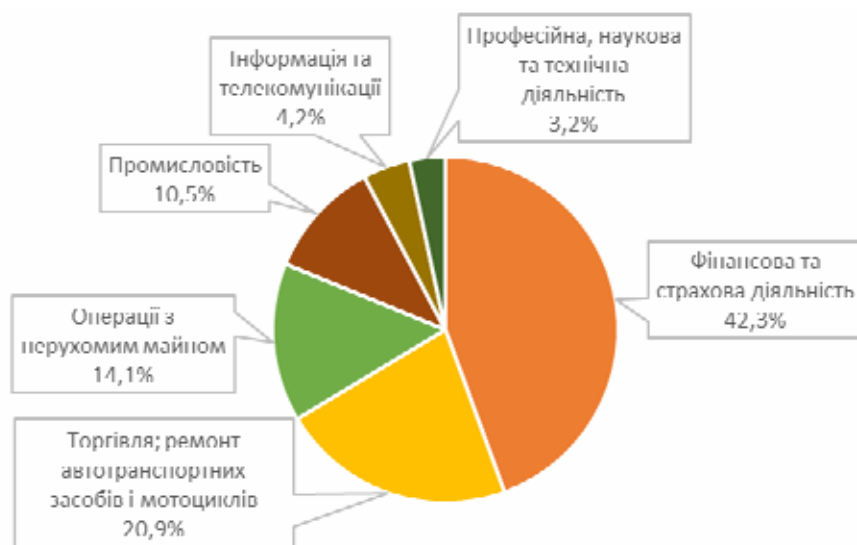
Рис. 3. Надходження прямих інвестицій в Україну за видами економічної діяльності у 2018 році

Прямі іноземні інвестиції, як виявив аналіз надходжень за видами економічної діяльності, спрямовуються у вже розвинені сфери господарської діяльності. Галузі економічної діяльності, відносно яких було направлено найбільші обсяги залучених прямих іноземних інвестицій представлено на рисунку 3.