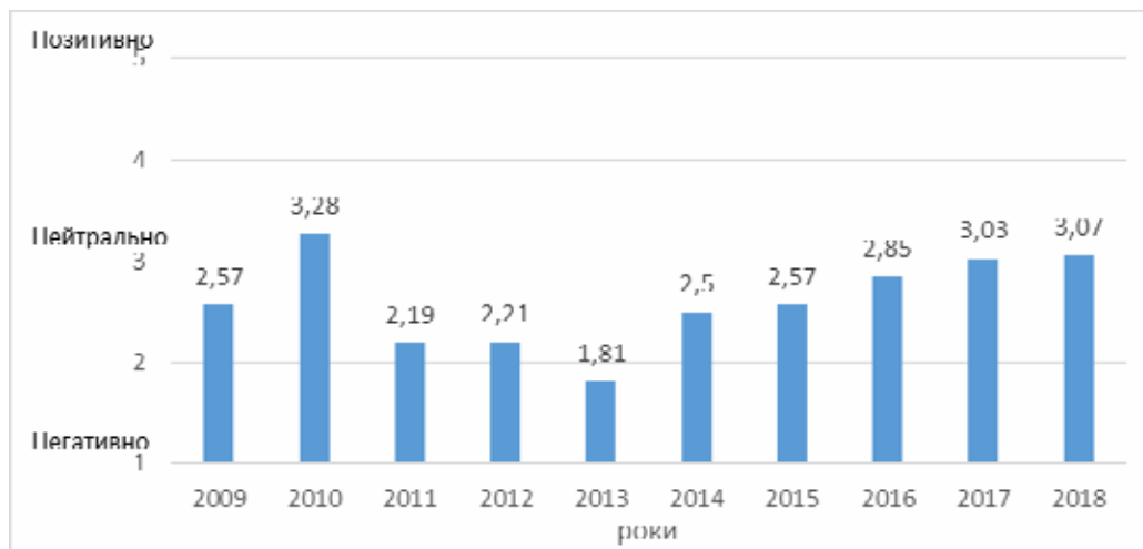
Рис. 4. Динаміка Індексу інвестиційної привабливості України за 2009 – 2018 роки

На основі проведеного дослідження, Європейська бізнес асоціація виділяє ряд стримуючих факторів, які впливають на процес залучення ПІІ в національну економіку. Одною з найважливіших є проблема захисту прав власності, оскільки саме невпевненість інвестора щодо можливостей збереження свого майна суттєво гальмує наміри щодо вкладення капіталу і бажання провадити господарську діяльність. На низький рівень економічної активності також впливають військові дії на сході країни й пов'язані із цим постійні ризики загострення ситуації, безсистемні зміни державної політики щодо інвестицій, широкомасштабна корупція, відсутність довіри до судової системи, непередбачуваний валютний курс та нестабільна фінансова система.